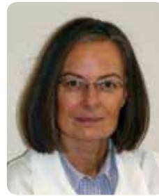
dr. Dine Houben Gynaecologie

Antwerpen en in Tilburg, werkte hij vier jaar in het Middelheim Ziekenhuis. Hij heeft ervaring in diverse neurochirurgische behandelingen: zowel craniaal als spinaal. Hij startte onlangs een gestructureerde pijnkliniek in het Jan Palfijn op (cf. pagina 5).